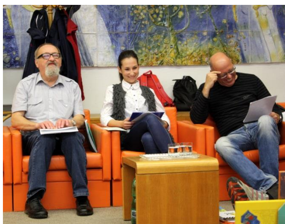
Čítanie bez bariér