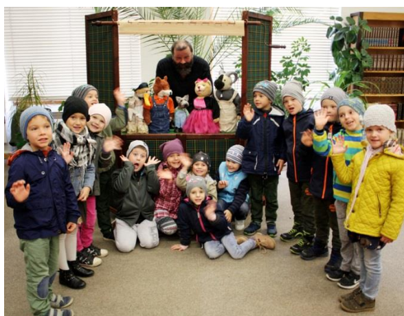
Týždeň česko-slovenskej vzájomnosti