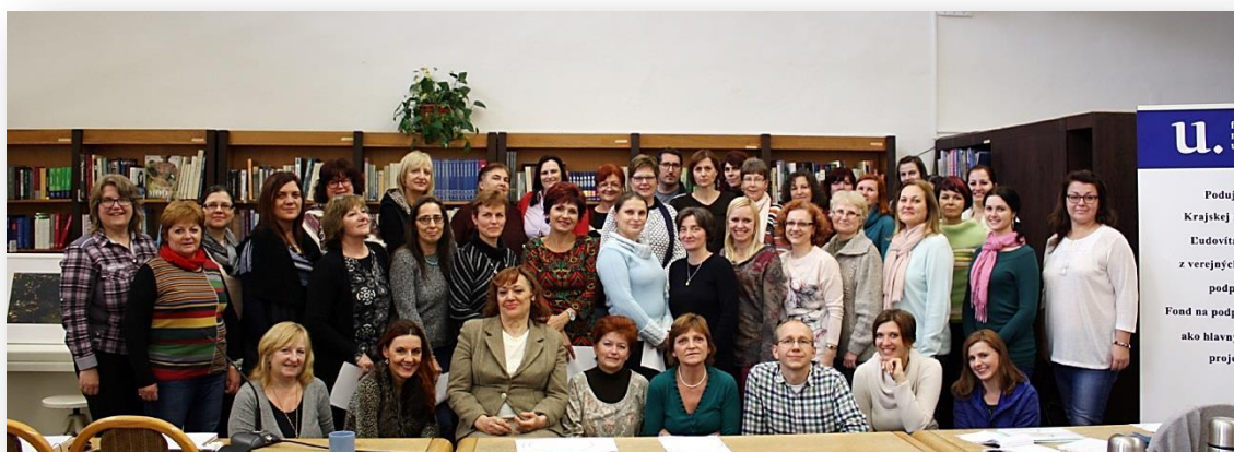
Základy biblioterapie pre knihovníkov