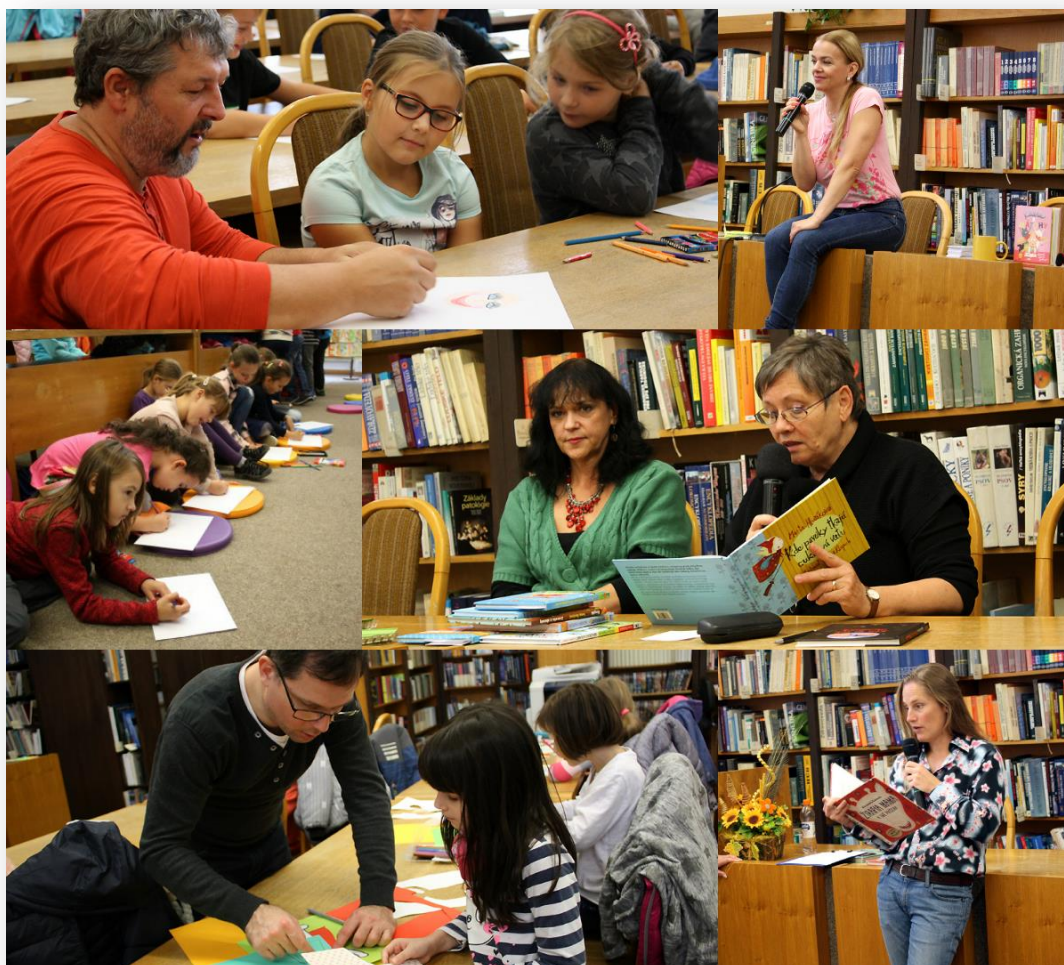
Deti, hurá do čítania 3